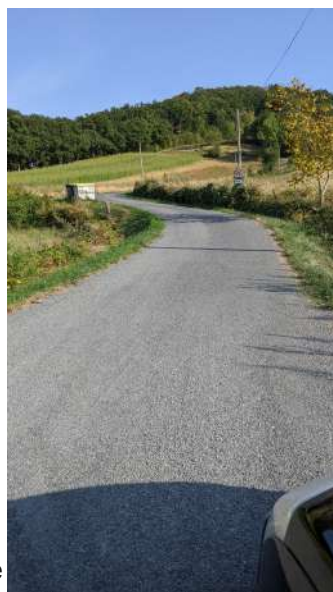
Route de la Pouzaque