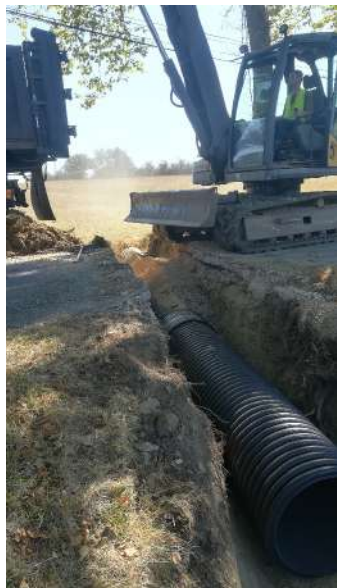
Allée de Touscayrats